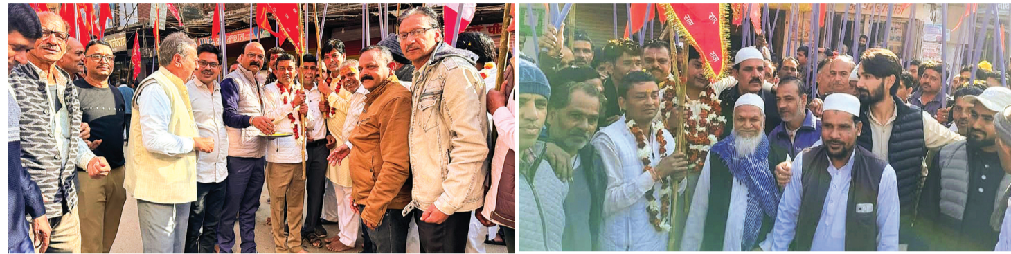
हरिभूमि न्यूज | गुना/आरोन

आरोन नगर से लगभग 25 किलोमीटर दूर गुना रोड स्थित प्रसिद्ध सेमरी बालाजी धाम तक निकाली गई भव्य पैदल झंडा यात्रा ने श्रद्धा, भक्ति और सामाजिक सौहार्द का अनुपम संदेश दिया। यह यात्रा न केवल धार्मिक आस्था का प्रतीक बनी, बल्कि इसमें हिंदू-मुस्लिम समुदाय की सहभागिता ने भाईचारे और राष्ट्रीय एकता की मिसाल पेश की। झंडा यात्रा का शुभारंभ सुबह ठीक 10 बजे नगरवासियों की आस्था के केंद्र श्री दास हनुमान मंदिर से हुआ। यात्रा से पूर्व सामूहिक हनुमान चालीसा पाठ एवं आरती का आयोजन किया गया। इसके पश्चात समाजसेवी प्रतिनिधियों द्वारा विधिवत झंडा दिखाकर यात्रा को रवाना