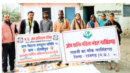
हरिभूमि न्यूज | गुना/आरोन

ग्राम विकास प्रस्फुटन समिति इलाहीपुरा की अंगनवाड़ी केंद्र में हुई संपन्न