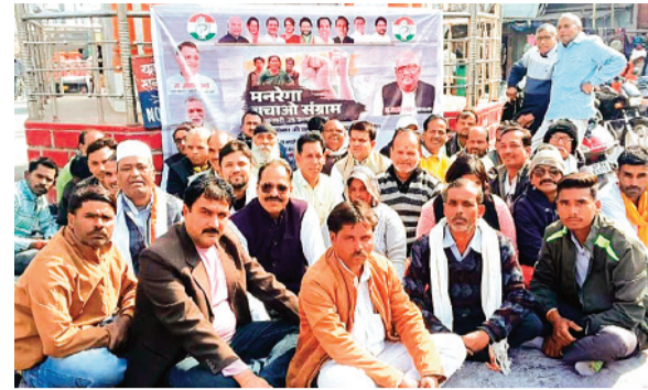
कांग्रेसियों ने घंटाघर पर किया सांकेतिक उपवास