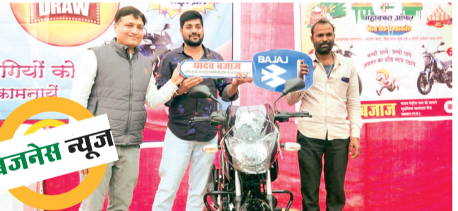
हरिभूमि न्यूज | ब्यावरा