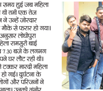
हरिभूमि न्यूज | राजगढ़

राजगढ़ में युवक की संदिग्ध मृत्यु मामले में निष्पक्ष जांच करने की रखी मांग