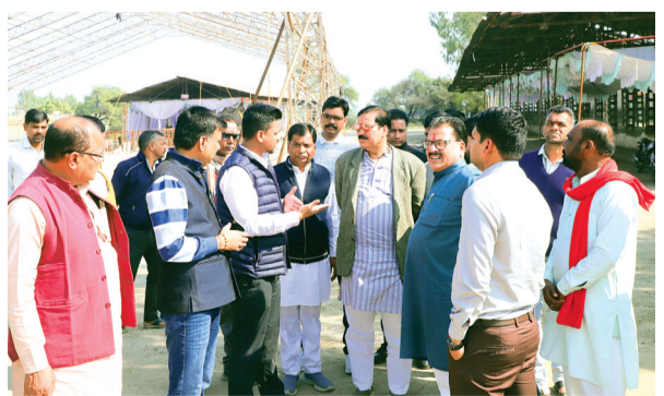
हरिभूमि न्यूज | सारंगपुर

रोजगार मेले का लाभ उठाए। युवा शक्ति को सशक्त, आत्मनिर्भर एवं रोजगारोन्मुख बनाने की दिशा में यह आयोजन एक मजबूत और प्राभावी कदम साबित होगा। युवा संगम रोजगार मेला को लेकर नगर के प्रमुख नागरिकों के साथ हुई महत्वपूर्ण बैठक बैठक में रोजगार मेले की तैयारियों, व्यवस्थाओं तथा युवाओं को अधिक से अधिक रोजगार अवसर उपलब्ध कराने को लेकर विस्तार से चर्चा की गई। साथ ही युवाओं की अधिकतम सहभागिता सुनिश्चित करने हेतु प्रचार-प्रसार एवं आवश्यक व्यवस्थाओं पर भी विचार-विमर्श किया गया। इस