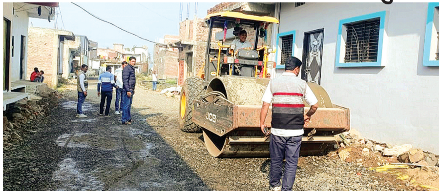
हरिभूमि न्यूज | कुरावर